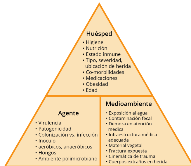
Figura 4. Triángulo epidemiológico que influye el riesgo de infección de herida por trauma 41

Las condiciones austeras de los militares en batalla quizás reflejen mejor los aspectos del triángulo epidemiológico de zonas rurales en países de bajos recursos. Murray, en su artículo, Field Wound Care: Prophylactic Antibiotics en una conferencia de "Tactical combat casualty care: transitioning battlefield lessons to other austere environments," menciona la gran contaminación de heridas, las condiciones del campo de combate como es la exposición al agua, la demora de atención adecuada a la herida, y los gérmenes distintos con más virulencia que existen en esos ámbitos. 42